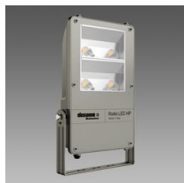
1898 Rodio HP - COB asymétrique