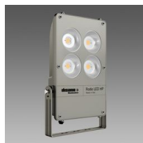
1897 Rodio HP - COB symétrique