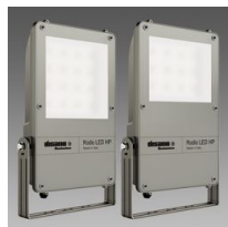
1890 Rodio LED HP - symétrique faisceau extensif