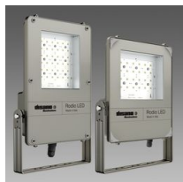
1890 Rodio LED - symétrique faisceau extensif