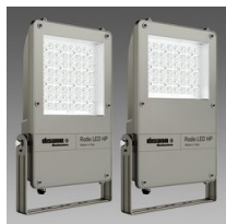
1888 Rodio LED HP - symétrique faisceau intensif