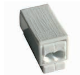
2 fils rigides / 1 fil souple