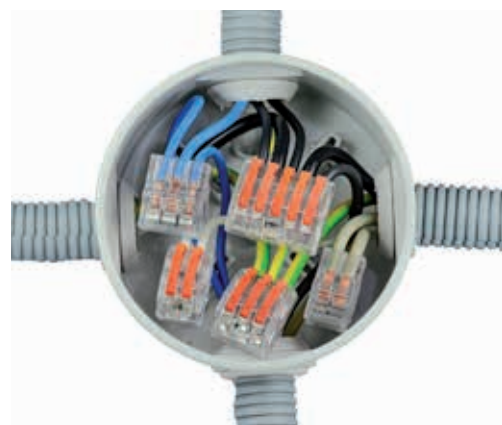
Pour connecter facilement tous types de circuits électriques