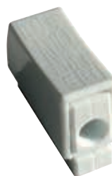
1 fil rigide / 1 fil souple