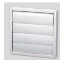
PER-100W Grille extérieure aluminium.