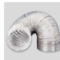
GSA-100 Conduit flexible aluminium.