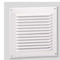
GRA-75 Grille plastique.